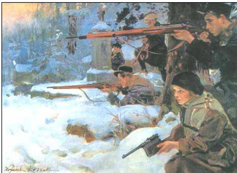
"Młody obrońca" i "Obrona Lwowa" - obrazy Wojciecha Kossaka. Orlęta Lwowskie, obrona cmentarza Łyczakowskiego.

Wreszcie historia jak gdyby doceniając wkład Orląt Lwowskich w walkę o kształt granic odradzającego się polskiego państwa sprawiła, iż przypadkowo wskazany poległy obrońca Lwowa, wybrany przez matkę jednego z poległych Orląt, przewieziony został do Warszawy, gdzie jego ciało złożono w grobie Nieznanego Żołnierza. Jeszcze do niedawna niewiele wiedziało, że oddając hołd nieznanemu polskiemu żołnierzowi, poległemu w obronie ojczyzny, kłania się Orłęciu Lwowskiemu poległemu w walce o polski Lwów.