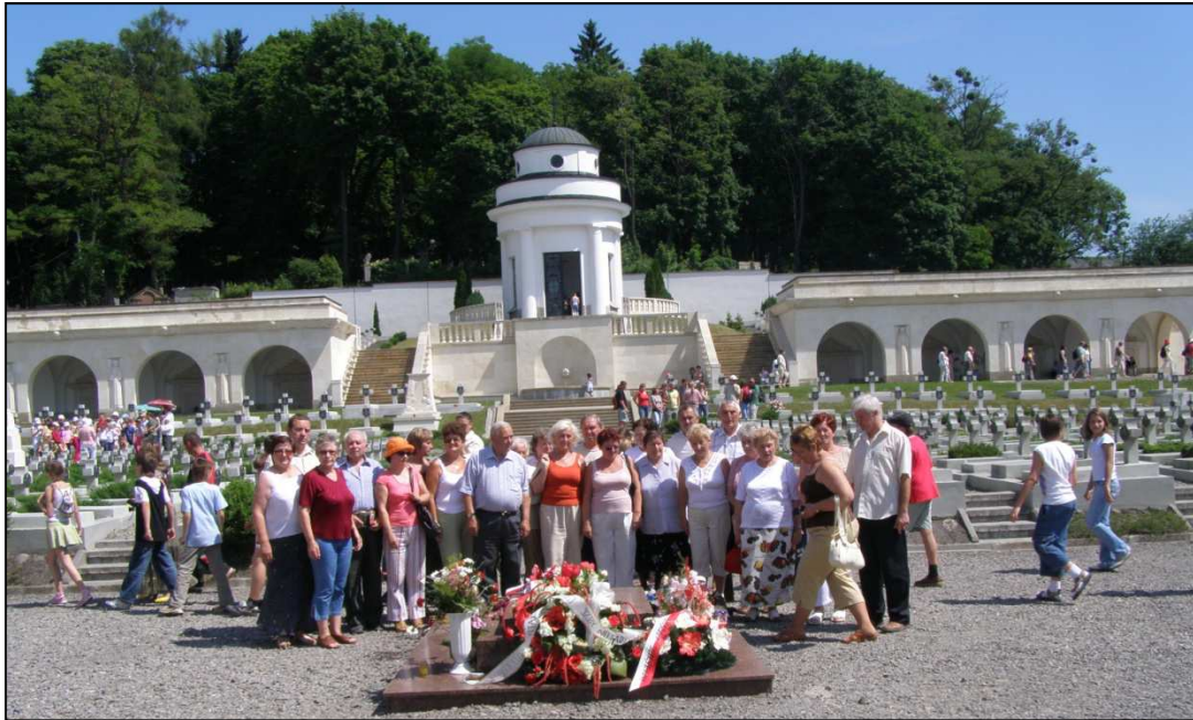
Namysłowanie na Cmentarzu Orłat

Dzisiaj niemyym świadkiem tamtych chwalebnych ale i tragicznych listopadowych dni, jest odbudowany, choć jeszcze nie do końca - Cmentarz Obrońców Lwowa, zwany potocznie „Cmentarzem Orłat Lwowskich”.