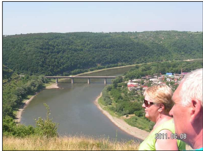
Pod Pomnikiem Konnicy Budionnego i zakole Dniestru w Zaleszczykach ze słynnym mostem drogowym

Dalej udaliśmy się do miejscowości Podhorce - posiadłości rodu Koniecpolskich, a potem Rzewuskich i Sanguszków. Zwiedziliśmy kościół parafialny przypominający Bazylikę św. Piotra w Rzymie. Następnie otoczenie pałacu, park z kolumnami i rzeźbami oraz pałac wraz z murami obronnymi, w którym za czasów ZSRR znajdowało się sanatorium gruźlicze. Pałac obecnie znajduje się w złym stanie technicznym.